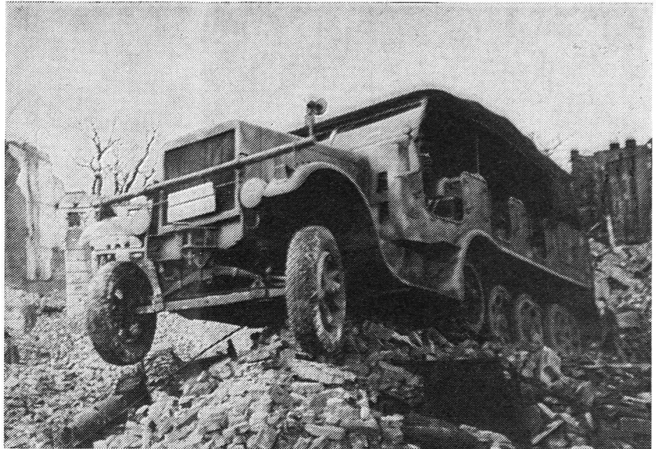
Die Bilder 6—9 zeigen Unimog- S-Rettungsfahrzeuge des zivilen Bevölkerungsschutzes auf Ko- lonnenübungsfahrt in weglosem Gelände.