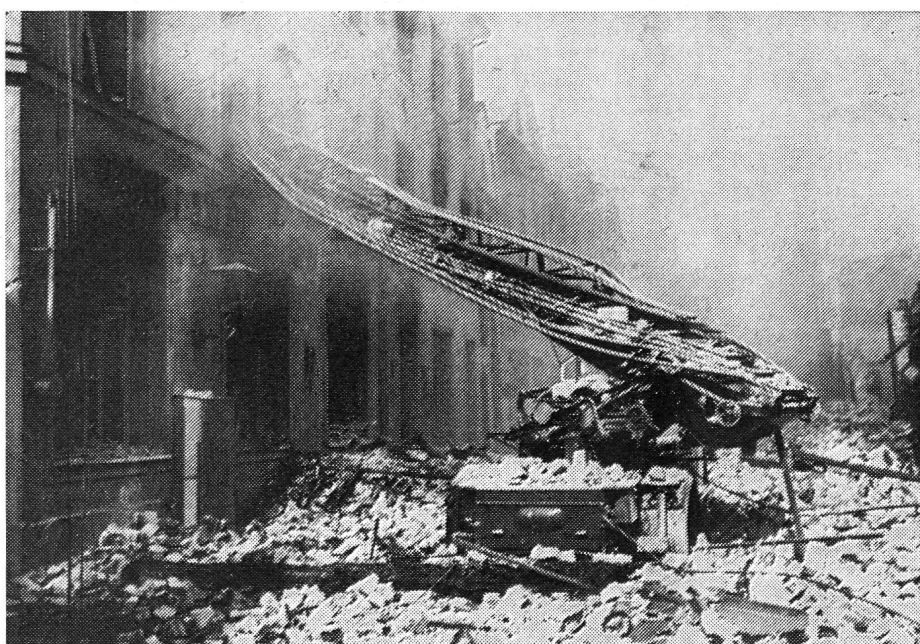
Bild 3 Durch Maueresturz beschädigte Feuerwehrliefer.