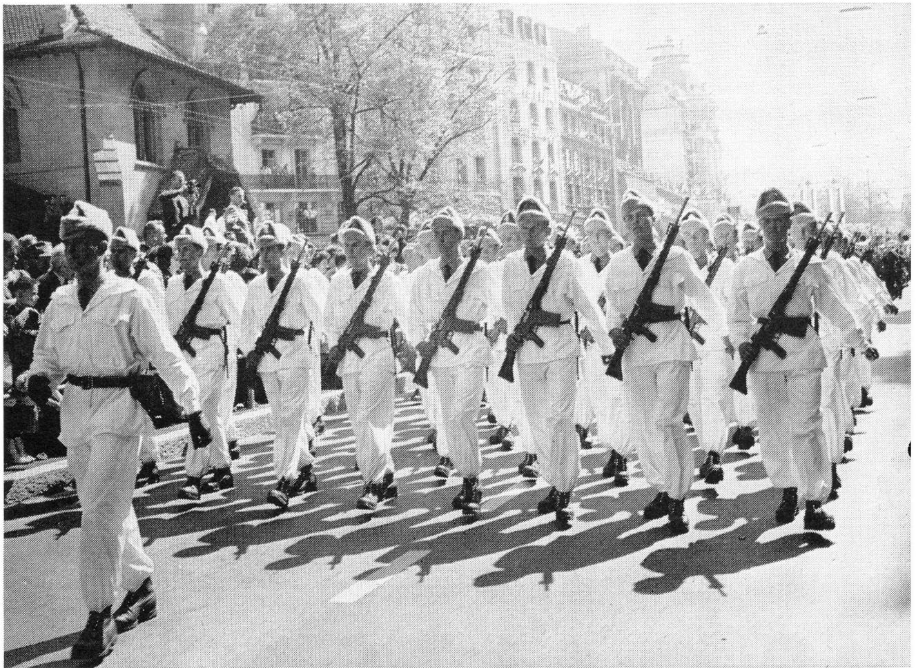
Ein Detachement vertrat auch die Gebirgstruppen der Armee.

der hier gezeigte Einsatz noch nichts aussagt über die Haltung unserer Wehrmänner und die Probleme, die wir unter dem Begriff der geistigen Landesverteidigung kennen. Es muss auch gesagt werden, dass mit dem hier kaum je zu errechnenden Aufwand ein Streifen entstand, der diesem Riesenaufgebot von Truppen, Fahrzeugen, Panzern, Fliegern und Munition entspricht und es schlimm wäre, hätten die dafür Verantwortlichen dieses Resultat nicht erreicht. Es ist nur zu hoffen, dass auch die Mittel noch vorhanden sind, um diesen auf 70-mm-Film gedrehten Streifen auch in Reduktionen auf 16-mm-Tonfilm der Verwendung im Vortragsdienst von «Heer und Haus» und anderer Institutionen zugänglich zu machen.