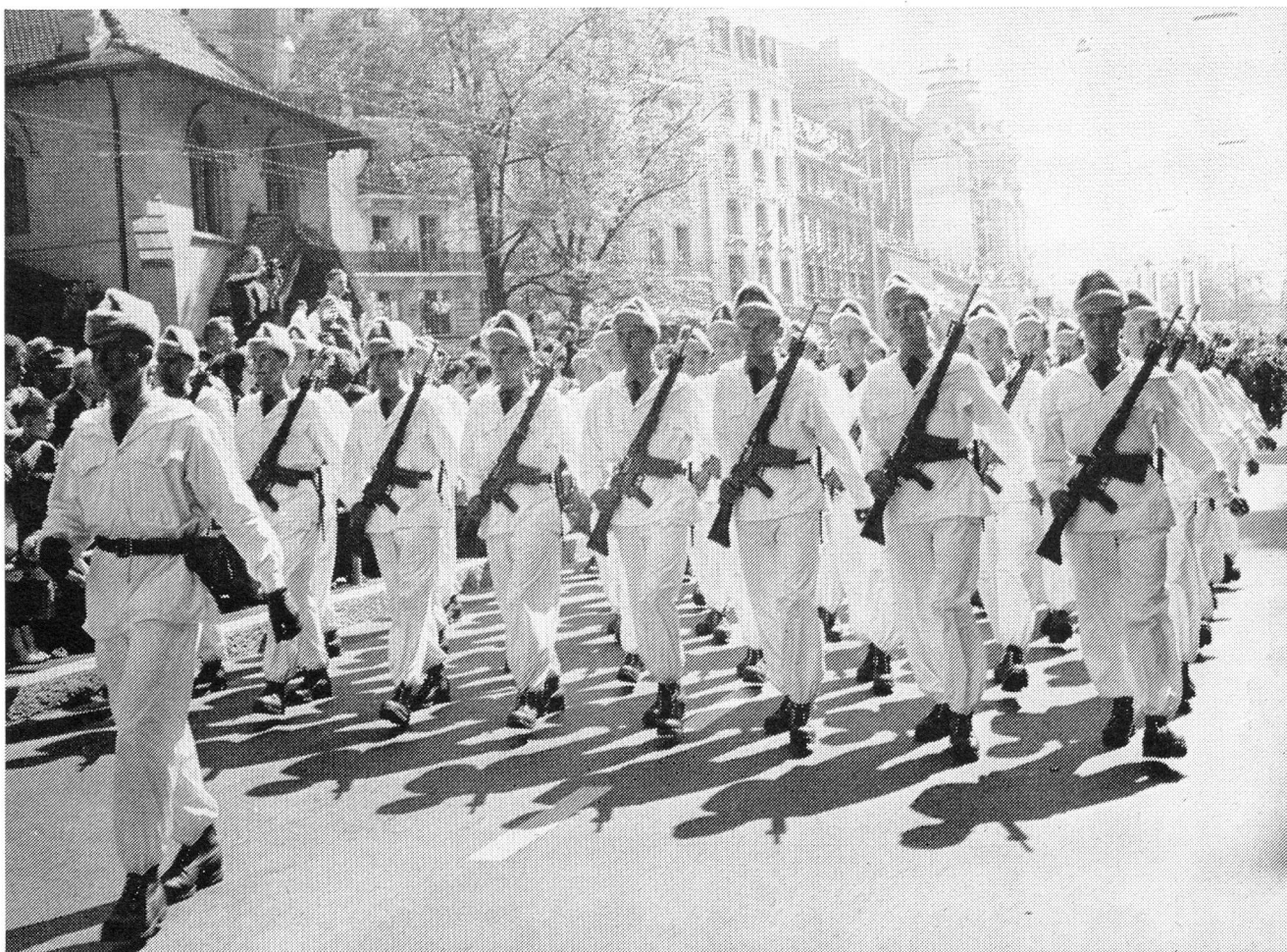
Ein Detachement vertrat auch die Gebirgstruppen der Armee.

der hier gezeigte Einsatz noch nichts aussagt über die Haltung unserer Wehrmänner und die Probleme, die wir unter dem Begriff der geistigen Landesverteidigung kennen. Es muss auch gesagt werden, dass mit dem hier kaum je zu errechnenden Aufwand ein Streifen entstand, der diesem Riesenaufgebot von Truppen, Fahrzeugen, Panzern, Fliegern und Munition entspricht und es schlimm wäre, hätten die dafür Verantwortlichen dieses Resultat nicht erreicht. Es ist nur zu hoffen, dass auch die Mittel noch vorhanden sind, um diesen auf 70-mm-Film gedrehten Streifen auch in Reduktionen auf 16-mm-Tonfilm der Verwendung im Vortragsdienst von «Heer und Haus» und anderer Institutionen zugänglich zu machen.