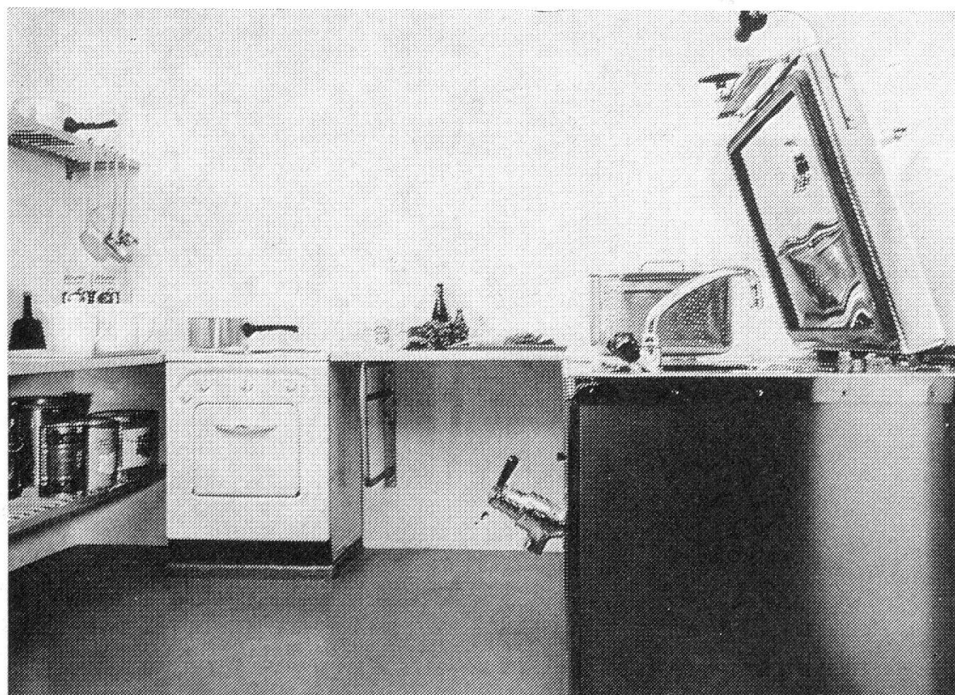
Die Küche mit dem Druckkochapparat

Bei einem allfälligen Ausfall der gesamten Stromversorgung dient eine Notbeleuchtung in den Gängen