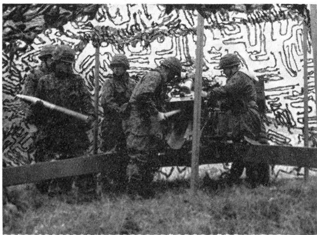
Artilleriestellung der Nordpartei im Wienerwald.