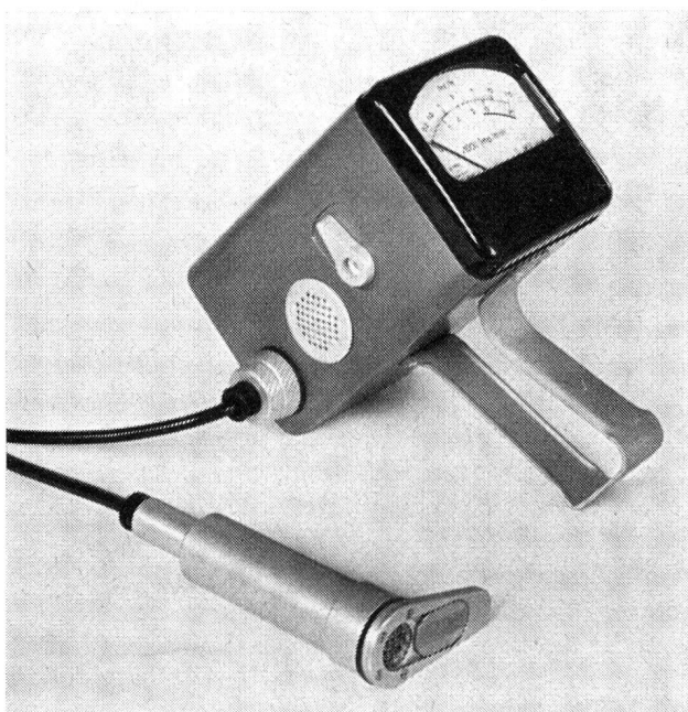
Abb. 3. Tragbares Suchgerät (transistorisiert)

Das Ausmass einer Schädigung durch Aufnahme radioaktiver Stoffe ist in erster Linie durch die aufgenommene Menge bestimmt. Diese ist durch die Aktivitätskonzentration des gefährdenden Mediums und die Aufenthaltszeit gegeben. Das Produkt dieser beiden Grössen ist massgebend. So führt ein hundertminütiger Aufenthalt in einem mit der Konzentration