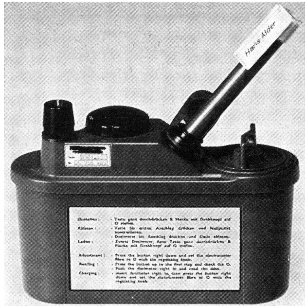
Abb. 4. Taschendosimeter mit Lade-Ablesegerät

1 verseuchten Raum zur gleichen Schädigung wie ein einminütiger Aufenthalt in einem mit der Konzentration 100 verseuchten. Für die Ueberwachungsgeräte bedeutet das, dass hohe Konzentrationen rasch nachgewiesen werden müssen, niedrige dagegen dürfen mit gleichem Risiko sinngemäss später entdeckt werden.