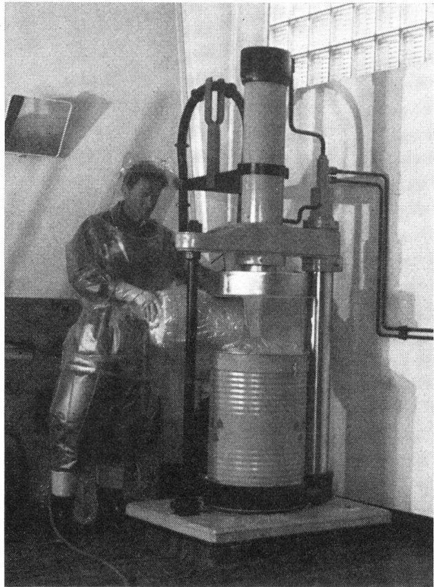
Abb. 3. Arbeiten in einem belüfteten Schutzanzug. Die Frischluftzufuhr erfolgt über eine Schlauchleitung.

Zu den regelmässigen Pflichten der Strahlenüberwachungsabteilung gehört auch die Kontrolle und der Schutz der Umgebung ausserhalb des Institutes. Weder über das Abwasser noch über die Luft darf Aktivität unkontrolliert das Areal verlassen. Zahlreiche Messungen, die behördlicherseits noch durch zusätzliche Kontrollen durch die Kommission für die Ueberwachung der Radioaktivität ergänzt werden, geben laufend ein Bild über den Aktivitätszustand in der Umgebung und gewährleisten den Schutz der umliegenden Bevölkerung.