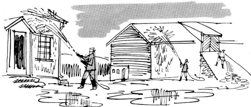
Der radioaktive Niederschlag kann durch Abspritzen entfernt werden.

Wie lange besteht eine Gefahr beim Genuss von Milch und Eiern von Tieren, die radioaktive Stoffe in sich aufgenommen haben? Diese Frage zu bantworten ist nicht möglich, solange man nicht weiss, wieviel Niederschlag die Tiere aufgenommen haben. Man muss daher damit rechnen, dass die Milch gefährlich ist, solange nicht eine Untersuchung