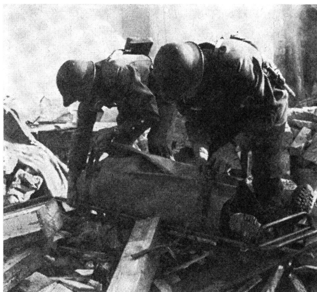
Aus den Trümmern geborgen, muss auf dem Rettungsbrett sachgemäss der Abtransport in die Wege geleitet werden, um die Verletzten sorgsam der Ersten Hilfe zuzuführen.