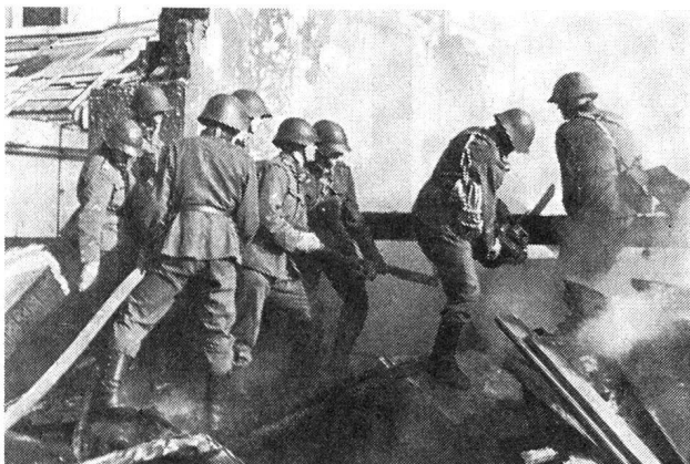
Balken und Holztrümmer, die den Weg versperren, werden mit der Motorsäge bearbeitet und der weitere Vormarsch freigelegt, um dann auch mit anderen Trümmern fertig zu werden.

Zivilschutzes. Er unterstrich, dass man bei der Schaffung der Truppenordnung 1951 mit Recht nicht davor zurückgeschreckt sei, bei der Armee einen Aderlass zugunsten des Schutzes der Zivilbevölkerung vorzunehmen. Ein solcher Aderlass, der damals selbstverständlich hingenommen wurde, ist leider heute wieder umstritten, obwohl er sich im Interesse eines schlagkräftigen Zivilschutzes aufdrängt. Oberst Jeanmaire verwies auch auf das kürzlich erschienene neue Reglement für den Einsatz der Luftschutztruppen, das ihre