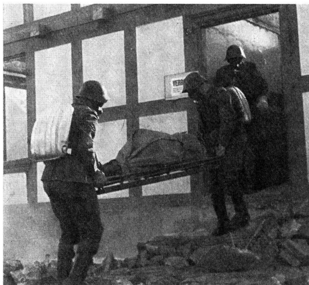
Die Rauchentwicklung hemmt das weitere Vorgehen. Eine Gruppe mit Sauerstoffgeräten wird eingesetzt, um in die Tiefe des Kellers vorzustossen, ihn nach Verschütteten abzusuchen und sie zu bergen.