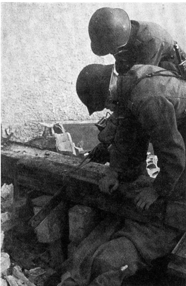
Die Rettungstrupps stossen auf die ersten Verschütteten, die es mit technischer Beihilfe zu befreien gilt.

Zivilschutzes. Er unterstrich, dass man bei der Schaffung der Truppenordnung 1951 mit Recht nicht davor zurückgeschreckt sei, bei der Armee einen Aderlass zugunsten des Schutzes der Zivilbevölkerung vorzunehmen. Ein solcher Aderlass, der damals selbstverständlich hingenommen wurde, ist leider heute wieder umstritten, obwohl er sich im Interesse eines schlagkräftigen Zivilschutzes aufdrängt. Oberst Jeanmaire verwies auch auf das kürzlich erschienene neue Reglement für den Einsatz der Luftschutztruppen, das ihre