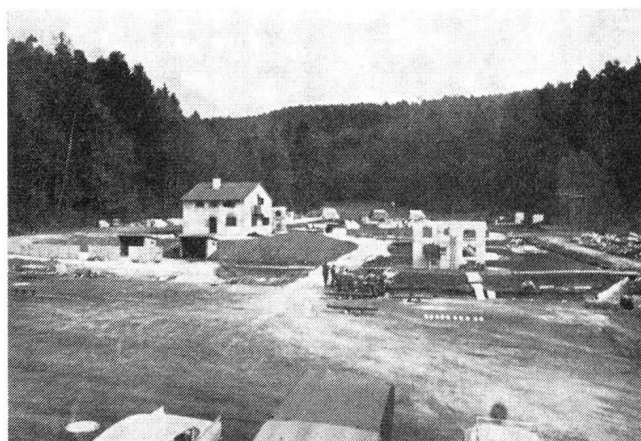
Blick auf das Uebungsgelände im «Orbüel»

Die Kursräumlichkeiten sind im Jahre 1968 während 42 Wochen und das Uebungsgelände während 28 Wochen mit Kursen von Bund, Kanton und Stadt belegt. Nach den bisherigen Feststellungen haben sich die Anlagen gut bewährt.