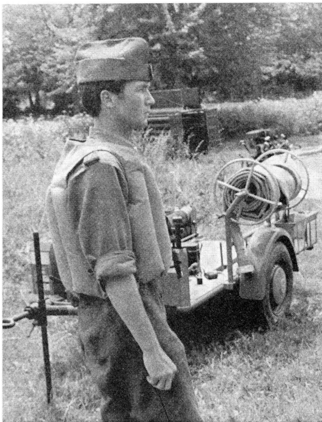
Abb. 6. Die für die Luftschutztruppe endgültig vorgesehene Schwimmweste

Zur Vereinfachung und zur Ueberprüfung der Sprengberechnungen wird eine Sprengdienst-Rechenscheibe mit Lederetui zu den Kommandoakten jeder Luftschutzkompanie abgegeben. Die