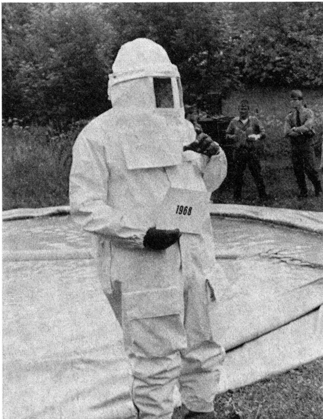
Abb. 1a. Der Schutzanzug Modell 1968

besteht aus einem Combinaison mit Gesichtslappen, einem Paar Hitzeschutzstiefeln und einem Paar Schutzhandschuhen. Er schützt gegen Hitzestrahlung bis ungefähr 200 °C und gegen das Löschwasser. Seine Entwicklung erforderte neun Jahre; in dieser Zeit wurden insgesamt sechs Prototypen in Grossversuchen erprobt, bis das endgültige Modell als beschaffungsreif erklärt werden konnte. Combinaison und Gesichtslappen sind aus einem beschichteten Gewebe hergestellt. Obwohl das weisse Material die Hitzestrahlung stark reflektiert, kann es sich auf der Aussenseite bis auf etwa 130 °C erwärmen; bei dieser Temperatur wird die Hitze für den Träger unerträglich. Zur Abkühlung genügt es nicht, dass sich der Mann aus der heissen Zone entfernt; die Hitze hält im Innern des Anzugs noch während Minuten so stark an, wie wenn der Mann noch direkt im Feuer stünde. Dieser Effekt kann zu Hitzestauungen führen. Davor kann man den Träger nur bewahren, indem man ihn mit dem Vollstrahl abspritzt. Durch den Aufprall des Wasserstrahls wird der Schutzanzug samt der darunter getragenen Kleidung an die