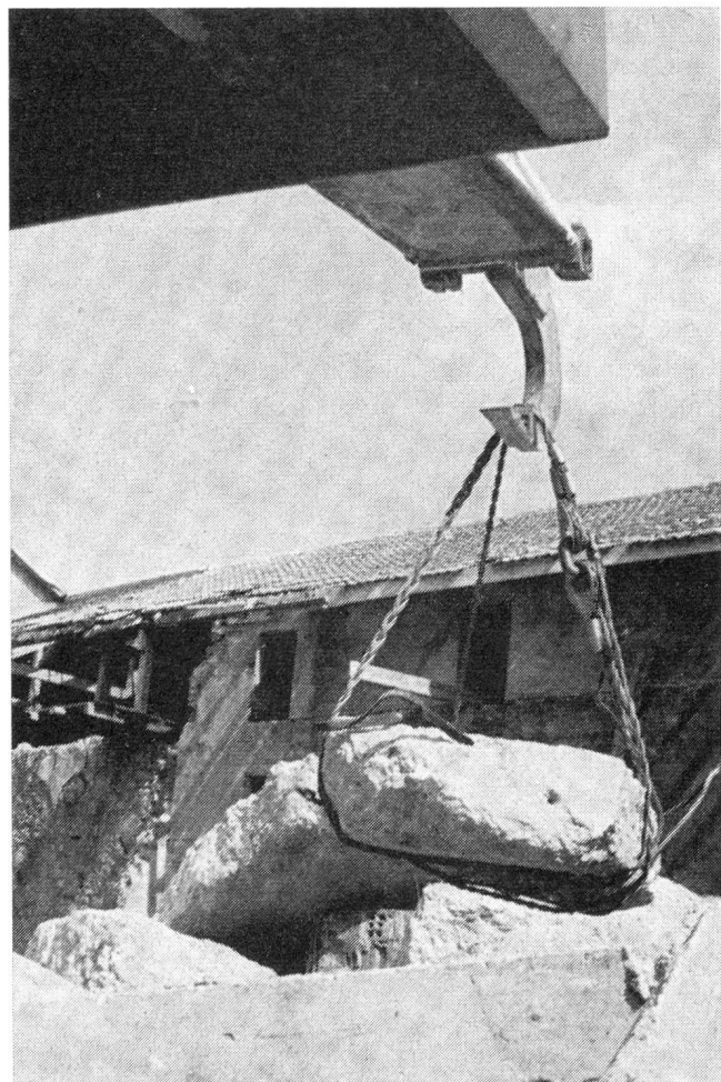
Abb. 3c. Verwendung der Drahtseilstripfen beim Herausheben eines Trümmerbrockens mittels Greifhaken des Teleskop-Baggers

Bei den Grossversuchen mit den Schutzanzügen hat sich gezeigt, dass die Führung des Luftschutzzuges stark erschwert wird, weil beim Tragen des Gesichtslappens und der Kapuze die Kommandi nicht mehr mündlich durchgegeben werden können. Die in der «Grundsicherung für alle Truppengattungen» für ähnliche Fälle vorgesehene Befehlsdurchgabe von Mann zu Mann oder durch Zeichen eignet sich nicht,