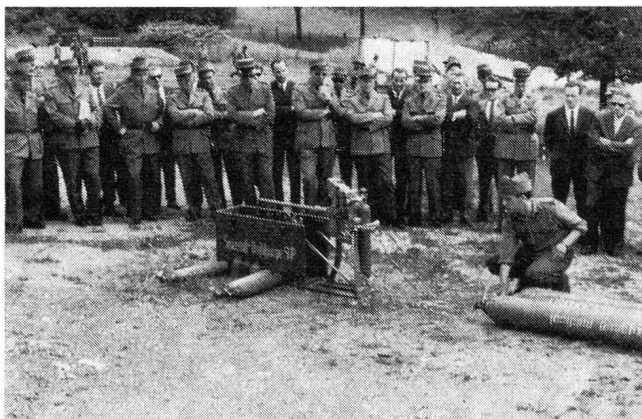
Abb. 4a. Sauerstoff-Handumfüllpumpe: Ueberströmen des Sauerstoffes aus der grossen Vorratsflasche in die Geräteflasche

In der Regel werden zwei bis drei Vorratsflaschen an die Umfüllpumpe angeschlossen. Das Ueberströmen (Umfüllung durch Druckausgleich ohne Betätigung der Pumpe) wird aus der Vorratsflasche mit dem niedrigsten Druck begonnen. Nach dem Ueberströmen wird gepumpt, bis in der Geräteflasche der Druck erreicht ist, der in der Vorratsflasche mit dem nächsthöheren Druck herrscht. Hierauf wird die erste Vorratsflasche geschlossen, die zweite geöffnet und bis zum nächsthöheren Vorratsdruck gepumpt, bis der Enddruck von 150 atü erreicht ist. Die Bedienung der Handumfüllpumpe ist Sache des Waffen-