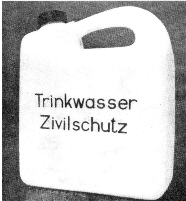
Trinkwassereinheitskanister. Auf Grund dieses Appells wurden über 2000 Einheitskanister gekauft, d. h. pro Haushalt 1 bis 20 Stück

Da eine Katastrophe irgendwo in der Schweiz jederzeit eintreten kann, scheint es uns angezeigt zu sein, dem Beispiel des Kantons Wallis folgend, zivile Katastrophenstäbe zu bilden und im übrigen Schulter an Schulter mit dem Zivilschutz und den für Wasserfragen zuständigen Instanzen für eine zeitverzugslose Verwirklichung der Notwasserversorgung im Katastrophen- und Kriegsfall zu kämpfen.