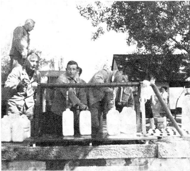
Trinkwasserabfüllanlage. Sie vermag 450 bis 650 10-Liter-Kanister pro Stunde abzufüllen

Ausnahmen heute die Regel ist. Um zu einer zeitlich und wirkungsmässig optimalen Lösung zu gelangen, empfiehlt sich — vorerst auf Bundesebene — die Anschaffung einer kleinern Zahl von mobilen, lufttransportierbaren Wasseraufbereitungsgeräten, welche, dezentral eingelagert, durch eine noch zu schaffende Einsatz- und Alarmzentrale des Bundesamtes für Zivilschutz in die Katastrophenzone transportiert werden könnten. Es scheint uns jedoch gegeben, dass die Kantone im Sinne der intra- und interkantonalen Katastrophenhilfe diesem Beispiel folgen sollten. Parallel dazu sind natürlich die Probleme der Wassernotreserven, der Wassertransporte und der Noterschliessung von Grundwasservorkommen ohne Verzug in Angriff zu nehmen.