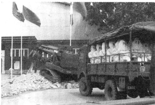
Vor der Ausstellungshalle zeigten die Luftschutztruppen ihr schweres Material und Spezialfahrzeuge. Auf einem Lastwagen mit Anhänger sass ein Zug Luftschutztruppen in der neuen Feuerschutzkleidung

Erwähnt sei auch der grosse Aufmarsch der Schulen aus Stadt und Kanton Luzern und auch aus anderen Kantonen, die mit ihren Lehrern die Schau besuch-