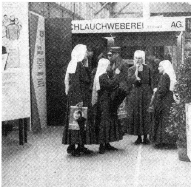
Blick in die Ausstellung, die aus allen Kreisen der Bevölkerung sehr gut besucht war und vor allem den Fachleuten des Zivilschutzes manche Anregung bot