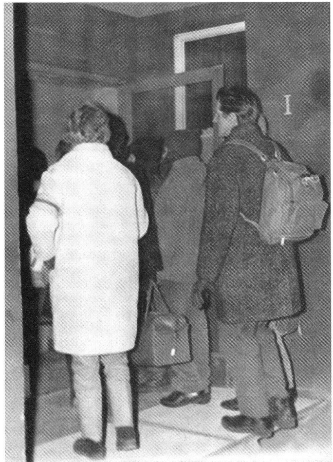
Problem Nummer eins: Unterkunft