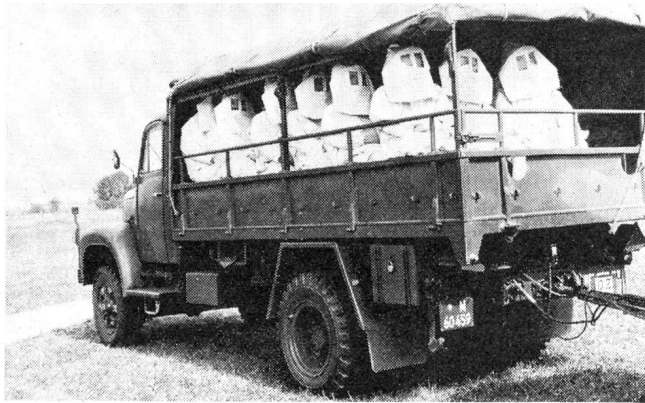
Bei den Luftschutztruppen war unter anderem dieser Camion mit einem Zug in modernen Asbestanzügen zu sehen