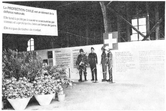
Sehr instruktiv wurde in einer Flughalle in den Zivilschutz eingeführt, um das Bild der Gesamtverteidigung anregend abzurunden