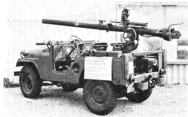
Umfassend war vor allem die Schau der Infanterie, wo auch die 10,5-cm-rückstossfreie-Panzerabwehrkanone 58 zu sehen war