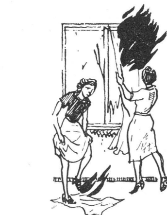
Aus der schwedischen Zivilverteidigung