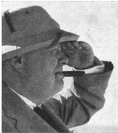
«Der Luftschutz, das Innenministerium und das Gesundheitsministerium befinden sich genau so in der vordersten Linie wie die Panzerkolonnen.»

Die Arbeiten des Verteidigungsforschungsinstitutes: Prüfung der Verteidigung gegen ABC-Waffen, den Gebrauch von Blutersatz, Schockbehandlungen, Untersuchungen der Wirkung von neuen Waffen zeigen, wie intensiv gearbeitet wird. Mehr als 3000 Zivilverteidigungs-Mitarbeiter sind in Ottawa ausgebildet worden. Obwohl die Bundesregierung bis jetzt den grössten Teil der Kosten getragen hat, wird darauf aufmerksam gemacht, dass Provinzen und Städte in gleicher Weise mitwirken müssen. Ja, es wird sogar die Auffassung vertreten, die Städte sollten selbst dann Bundesbeiträge erhalten, wenn die Provinzen, bei uns der Kanton, noch nicht genügend leisten würden. In einem gemeinsamen Geiste der Verantwortlichkeit sollen die Provinzen und Gemeinden alles tun, was in ihren Kräften steht, um die Bevölkerung zu schützen, denn auch in Friedenszeiten kann eine richtige Organisation im Katastrophenfall eine wertvolle Hilfe sein.