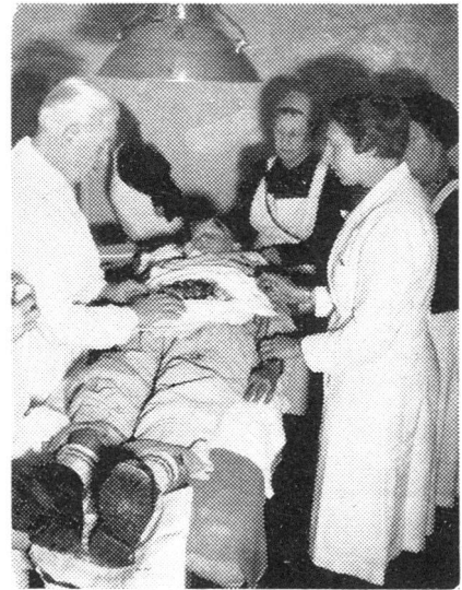
Operationstisch einer Sanitätshilfsstelle in Luzern, in realistischem Uebungsbetrieb.

Die nächste Aufgabe ist die Bereitstellung der Kader für die SHS. Die Kader werden vorwiegend durch die Samaritervereine und das Rote