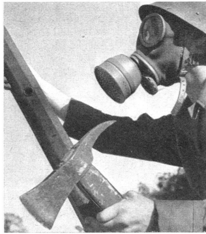
Angehörige eines schwedischen Industriebetriebes im Einsatz als Beobachter (links) und als Feuerwehrmann (rechts) an einer Uebung ihres Betriebsschutzes.