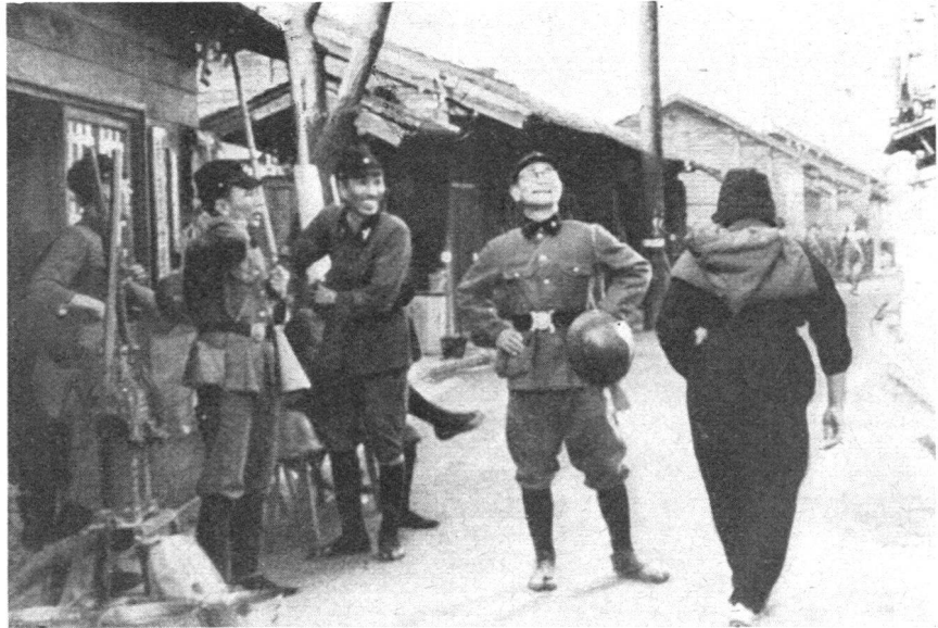
Es gab keinen Fliegeralarm

Inzwischen bleiben zivile Schutzmassnahmen nötig . Jedenfalls hat die westdeutsche Bundesregierung neuerdings die Frage, ob Luftschutz noch einen Sinn habe, aus guten Gründen mit «Ja!» beantwortet und das Luftschutzbudget von 12 auf 82 Millionen DM erhöht. Und der kluge spanische Botschafter Salvador de Madariaga hat die Weltlage wie folgt gekennzeichnet: «Der Krieg im grossen Maßstab ist durch die Wasserstoffbombe aus dem Bereich der Möglichkeiten ausgeschaltet worden. Daher müssen wir alle unsere Ueberlegungen am Kalten Krieg orientieren». Dass die politischen Ursachen gewaltsamer Konflikte unter der augenblicklich etwas geglättet erscheinenden diplomatischen Oberfläche der internationalen Beziehungen fortbestehen und jederzeit wieder in begrenzte Kriege mit herkömmlichen Waffen ausarten können, ist Tatsache. Daran ist zu denken, wenn es um die Beurteilung, Bewilligung und Ausführung neuer Luftschutzmassnahmen geht. Reale Ueberlegungen und entsprechende Vorkehrungen müssen — leider — schöneren Wünschen und Hoffnungen vorangehen. Ein ausgebautes Warnsystem und der rechtzeitige Bau von Schutzräumen gehören daher zu den wichtigsten Lehren der Katastrophe von Hiroshima.