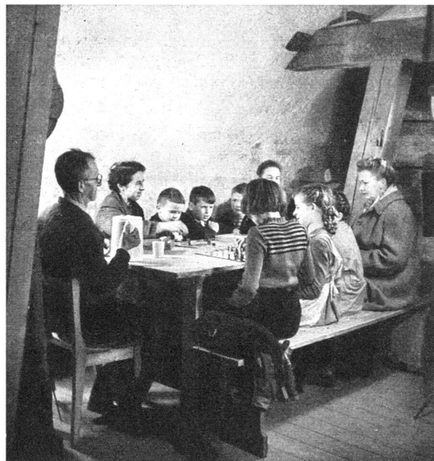
Ablenkende Beschäftigung ist wichtig

Allfällige Regionsinstruktoren sind die Gehilfen der Kantonsinstruktoren. Sie leiten und beaufsichtigen nach Weisung des Kantons die Organisation und Ausbildung der Hauswehren in der betreffenden Region.