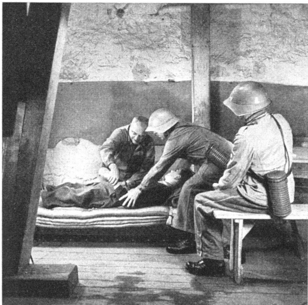
Pflege eines Verletzten

Nachbarhaus, während die Kriegsfeuerwehr im Innenangriff den Brandherd angeht. Die Hauswehren können aber auch zur Bekämpfung des Flugfeuers eingesetzt werden. Entsteht im übrigen in der Löschaktion der Kriegsfeuerwehr vorübergehend ein Unterbruch, z. B. durch den Ausfall einer Motorspritze, so können es wieder zusammengefasste Mittel der Hauswehren sein, welche bis zum erneuten Angriff der Kriegsfeuerwehr das Feuer so lange an der Weiterausbreitung hindern.