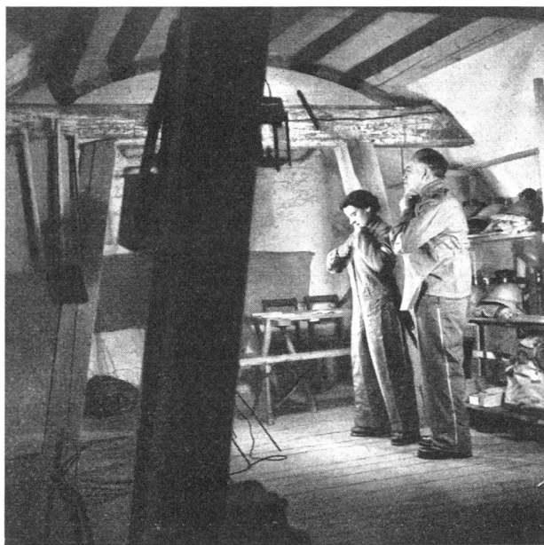
Bei Fliegeralarm bezieht die Hauswehr ihren Posten

Bei der Bombardierung von Basel am 4. März 1945 wurden 79 Häuser von Brandbomben getroffen, viele davon gleich von mehreren. In 61 Fällen konnten die Entstehungsbrände von den Hausfeuerwehren gelöscht werden, trotzdem diese Organisation zu dieser Zeit nicht auf Pikett gestellt war.