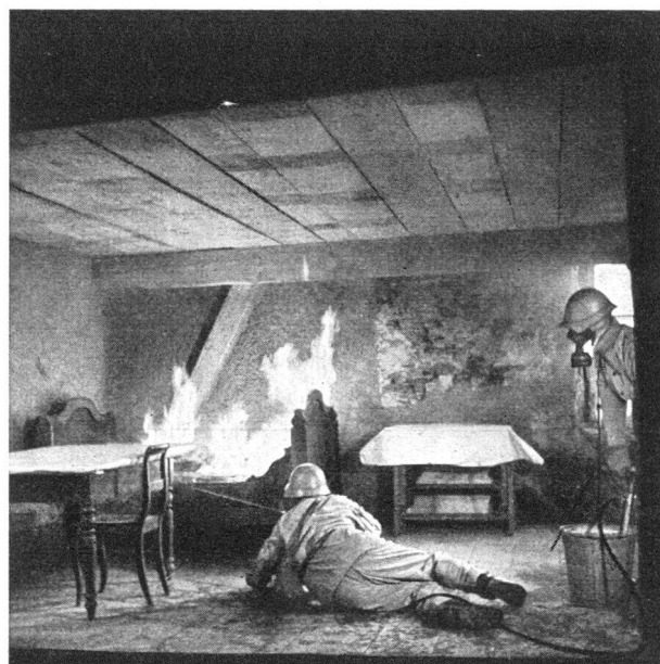
Löschung eines Zimmerbrandes

Die Hauswehren sind jedenfalls geeignet, den Fatalismus und die Panikstimmung zu überwinden und die Abwehrbereitschaft in einem äusserst wichtigen Teil des Zivilschutzes unter Umständen entscheidend zu stärken.