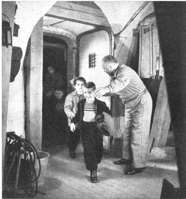
Die Hausinsassen gehen in den Schutzraum

An der Spitze der Organisation der Hauswehren steht in der Ortschaft der Dienstchef. In grösseren Ortschaften mit mehr als 3000 Einwohnern wird zudem auf je 2000—4000 Einwohner als Zwischenglied ein