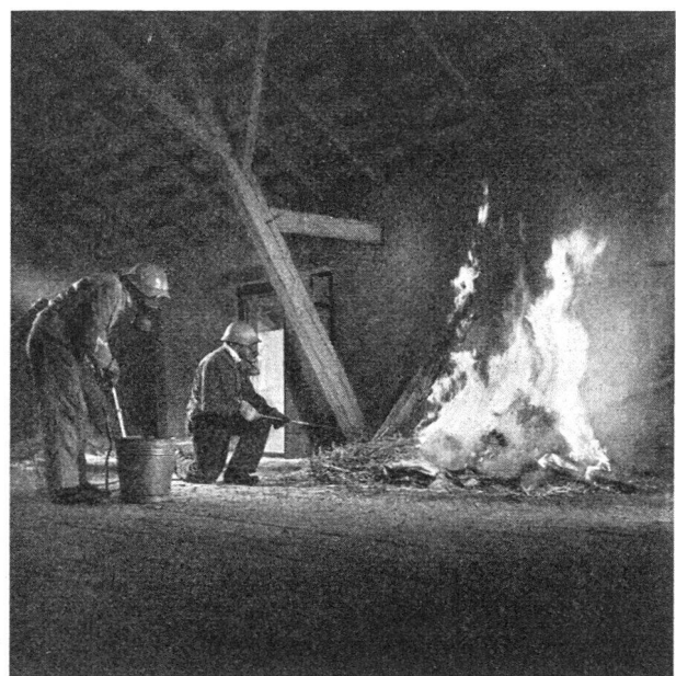
Erfolgreiche Schadenbekämpfung mit Eimerspritze und Feuerhaken