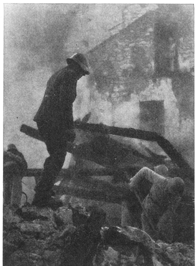
Befreiung von Verschütteten