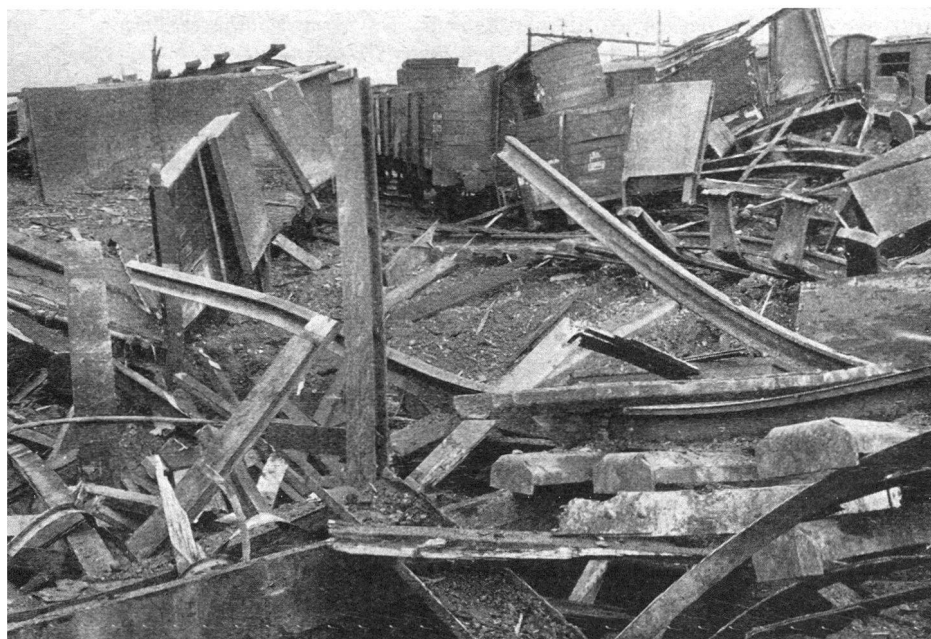
Oben und unten: Nach der Bombardierung der Stadt am 4. März 1945