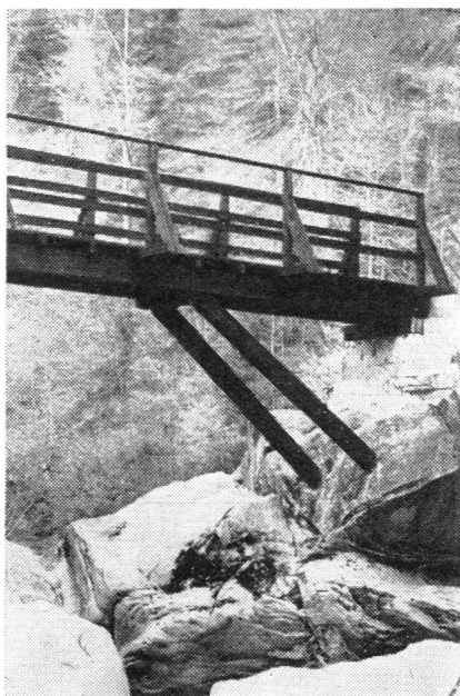
Die fachmännisch ausgeführte Holzkonstruktion zeugt vom Können unserer Luftschutzsoldaten

Es war wirklich eine Luftschutzkompanie, welche die Stege zur Uebung ihrer Fertigkeiten erstellte. In starkem Holz, auf Zwischenstützen erstellt, werden sie viele Jahre überdauern und damit vom technischen Können der Erbauer zeugen. Noch erscheinen sie schwarz in ihrem frischen Karbolanstrich, aber die Witterung wird sie bald aufhellen, und dann werden sie sich prächtig in die