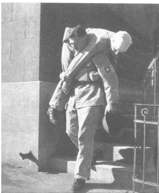
Bergung eines Verwundeten.