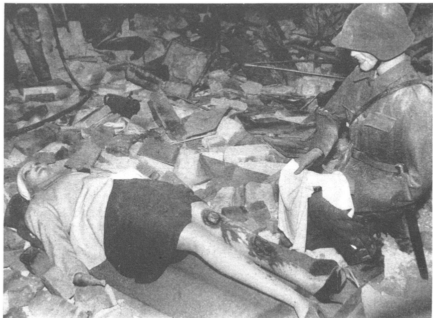
Erste Hilfeleistung durch Luftschutztruppe

Die Ausbildung des Kadets ist daher dringend nötig und darf neben der Grundausbildung nicht vernachlässigt werden. Neben die Allgemeinbildung muss die Ausbildung für die Funktion treten, für die die Betreffenden vorgesehen sind. Es muss ihnen auch immer wieder Gelegenheit gegeben werden, in ihrer Funktion tätig zu sein.