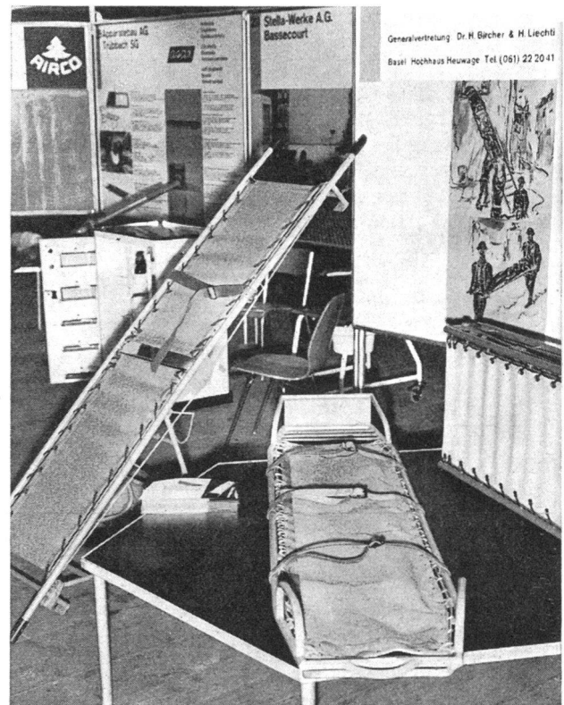
Blick in mehrere Firmenstände