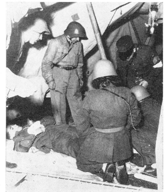
Erste Hilfe in einem Verwundetennest der Betriebsschutzorganisation der SBB.

Unerbittlich tönt die Meldung an eine Luftschutz-Kompagnie, die im Stadttinnern im Einsatz stand: «Die Lage hat sich im allgemeinen in der Stadt gebessert, einzig im Gebiet, wo diese Kompagnie steht, verunmöglicht Hitze und Rauch ein wei-