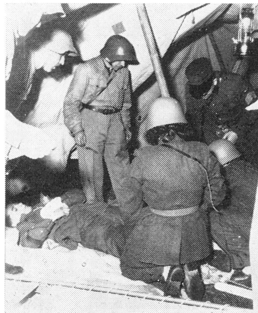
Erste Hilfe in einem Verwundetennest der Betriebsschutzorganisation der SBB.

Unerbittlich tönt die Meldung an eine Luftschutz-Kompagnie, die im Stadttinnern im Einsatz stand: «Die Lage hat sich im allgemeinen in der Stadt gebessert, einzig im Gebiet, wo diese Kompagnie steht, verunmöglicht Hitze und Rauch ein wei-