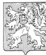
Zivilschutzübungen in der Tschechoslowakei

Zur Ergänzung sind örtliche Ausstellungsgegenstände sowie die gleichzeitige Veranstaltung von Aufklärungsabenden mit Hilfe kantonalen Sektionen des Schweiz. Bundes für Zivilschutz vorgesehen.