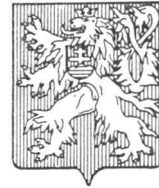
Zivilschutzübungen in der Tschechoslowakei

Zur Ergänzung sind örtliche Ausstellungsgegenstände sowie die gleichzeitige Veranstaltung von Aufklärungsabenden mit Hilfe kantonalen Sektionen des Schweiz. Bundes für Zivilschutz vorgesehen.