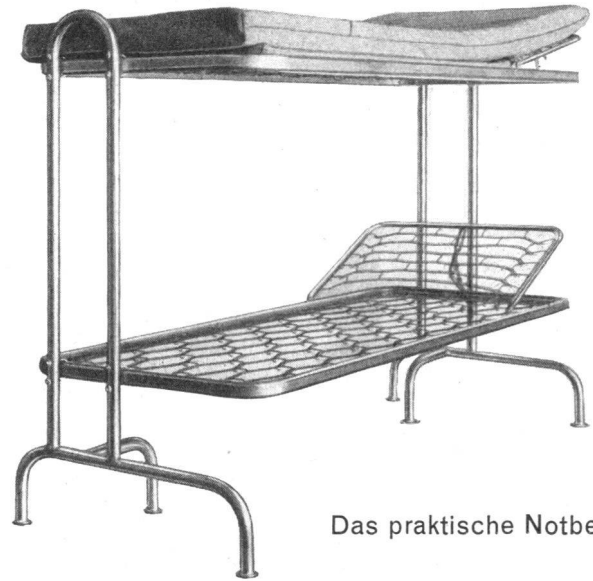
Das praktische Notbett

Wullschleger & Schwarz Basel 1 Unterer Heuberg 2 Tel. 061 / 24 89 29