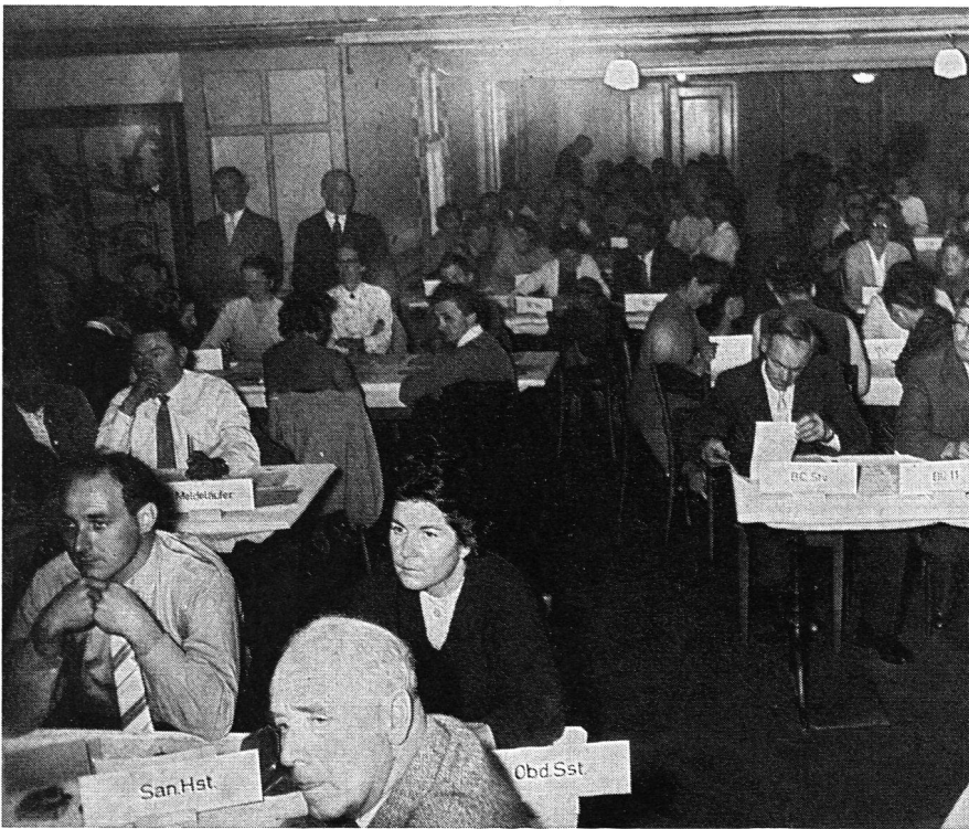
Der «Kronen»-Saal bildete eine einzige, das Kader einer ganzen Gemeinde umfassende Schicksalsgemeinschaft des Zivilschutzes, um zusammen auf die Probleme einzugehen, die ein Kriegs- und Katastrophenfall aufwerfen kann.