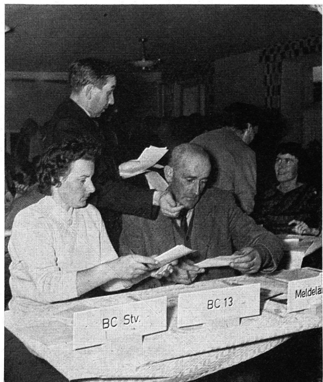
Hier sehen wir den Blockchef Nr. 13 mit seiner Stellvertreterin auf seinem «Kommandoposten» im «Kronen»-Saal, um in der für ihn gegebenen Lage die sich aufdrängende Beurteilung zu machen, Entschlüsse zu fassen, zu melden und zu erkennen, dass auch sein Beitrag im Rahmen des örtlichen Zivilschutzes von entscheidender Bedeutung sein kann.