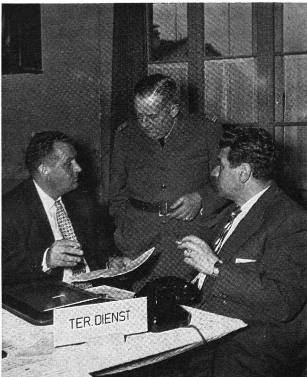
An der instruktiven Planübung nahmen auch die Vertreter des Territorialdienstes teil, die Gelegenheit erhielten, über die Probleme und Massnahmen ihres Arbeitsbereiches in der gegebenen Situation Auskunft zu erteilen, um so allgemein beim Zivilschutzkader von Hombrechtikon Verständnis für die notwendige gute Zusammenarbeit von Zivilschutz und Armee zu wecken.