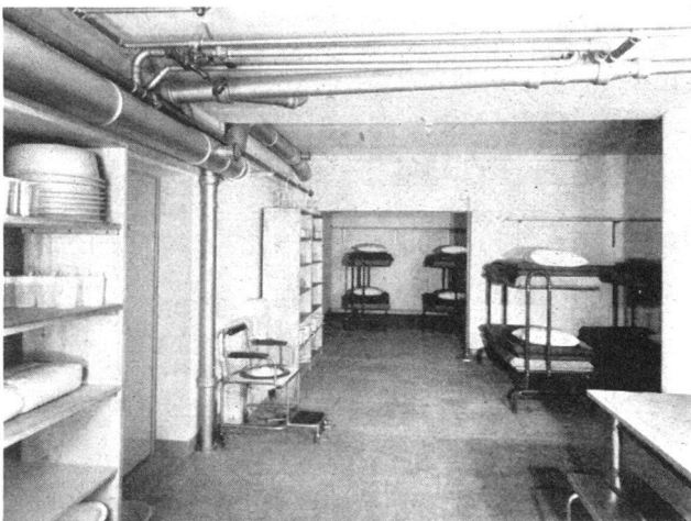
Sanitätshilfsstelle des Basler Zivilschutzes

Arbeiten des Hoch- und Tiefbaues geschult, hilft bei Instandstellungen und Räumungen, nimmt sich beschädigter Gas- und Wasserleitungen an und repariert unterbrochene elektrische Leitungen.