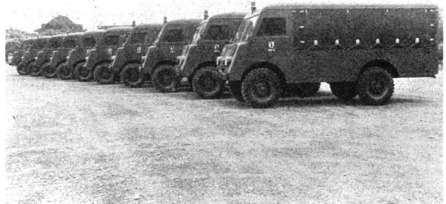
Wagenpark der Basler Kriegsfeuerwehr

Aus dieser Schilderung geht klar hervor, dass das Schwergewicht des Zivilschutzes und die Verantwortung für alle Massnahmen bei der Gemeinde liegen. In der Gemeinde, der kleinsten Zelle unseres Staatswesens, ist auch die natürliche Lebensordnung im Frieden organisiert und gewährleistet. Es kommt daher nicht von ungefähr, dass bewusst darauf ausgegangen wird, auch in Kriegs- und Katastrophenfällen möglichst viele dieser Zellen am Leben zu erhalten, um damit auch das Weiterleben der Kantone und der Eidgenossenschaft zu gewährleisten. Es ist die vornehmste und schönste Aufgabe des Zivilschutzes, in Kriegs- und Katastrophenfällen das Leben zu erhalten.