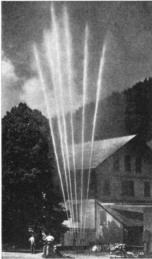
VOGT-MOTORSPRITZEN und Armaturen in jeder Ausführung Gebrüder Vogt - Maschinenfabrik - Oberdiessbach BE - Gegründet 1916