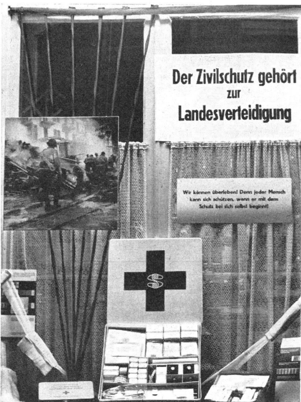
Eine Apotheke verband die Zivilschutzaufklärung mit der Ausstellung zweckmässigen Sanitätsmaterials für die Erste Hilfe, wie es mit dem Notvorrat in jeden Haushalt gehört.