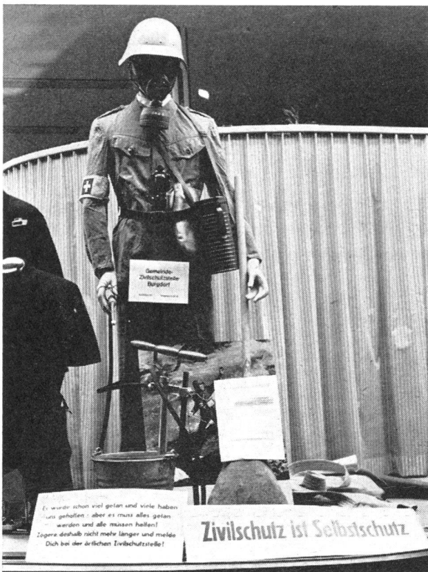
In die Schaufensterfront eines Konfektionsgeschäftes eingebaut, fand dieser Hauswehrmann mit seinem Gerät viel Beachtung.

Ein Beispiel dafür, was alle Gemeinden heute schon tun können!