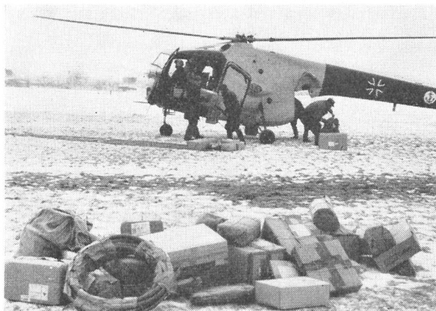
15 Marineflieger der Bundeswehr bringen Post auf eine vom Eis eingeschlossene Insel.

Sparten des Katastrophen- und des Zivilschutzes viel mehr als bisher Aufklärung darüber erhalten, wann und wie man Luftfahrzeuge einsetzen kann und was diese zu leisten vermögen. Nur durch enge Zusammenarbeit zwischen den herkömmlichen Rettungsdiensten auf der Erde und der fliegenden Hilfe kann ein bestmögliches Ergebnis für alle Beteiligten, nicht zuletzt für die hilfsbedürftigen Opfer von Katastrophen, erzielt werden.