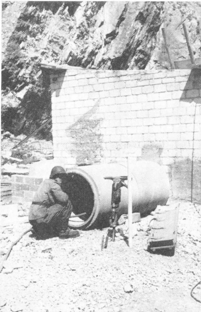
Das ist die «Klagemauer», an der im engsten Raum unter Einsatz von Pressluftbohrern oder andern Mitteln Mauerdurchbrüche geübt werden.