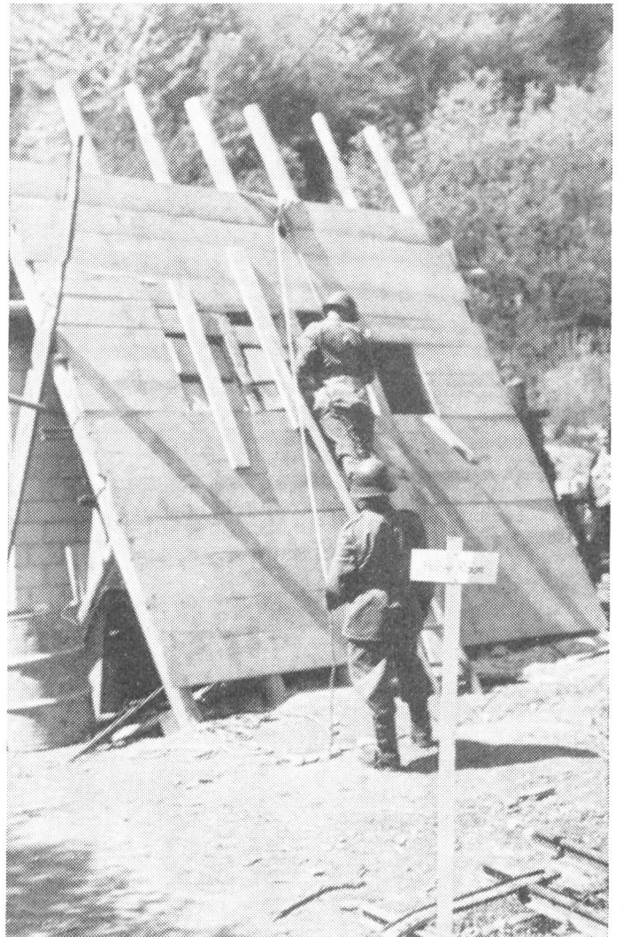
Diese Station nannte sich «Halber Raum», eine vorkommende Situation beim Einsturz von Häusern, der für die Bergung von Verletzten wieder ein anderes Vorgehen verlangt.