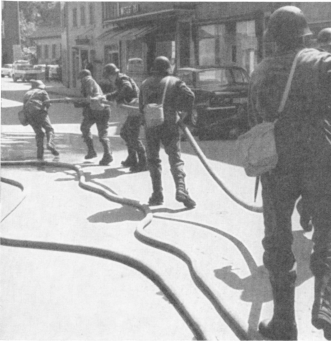
Dieses Bild vermittelt einen guten Eindruck des Einsatzes der Luftschutztruppen in Balsthal, wo viel Eifer und Können gezeigt wurde.