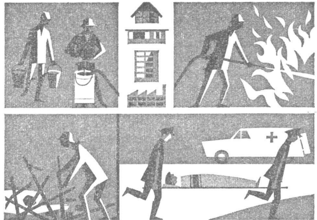
Civilforsvarets hjælpetjeneste, der i vidt omfang er baseret på frivillig tilslutning, står parat til at yde befolkningen assistance under katastrofer, bl. a. med brandslukning, redning og rydning.