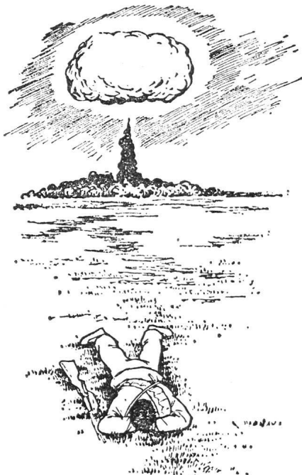
图四 无地形、地物可利用时,应就地背向爆炸中心卧倒,并将手掩盖好

wird der Zivilschutz vor allem von den Kommunisten bekämpft, denen sich unbelehrbare Pazifisten und Querulanten zugesellen.