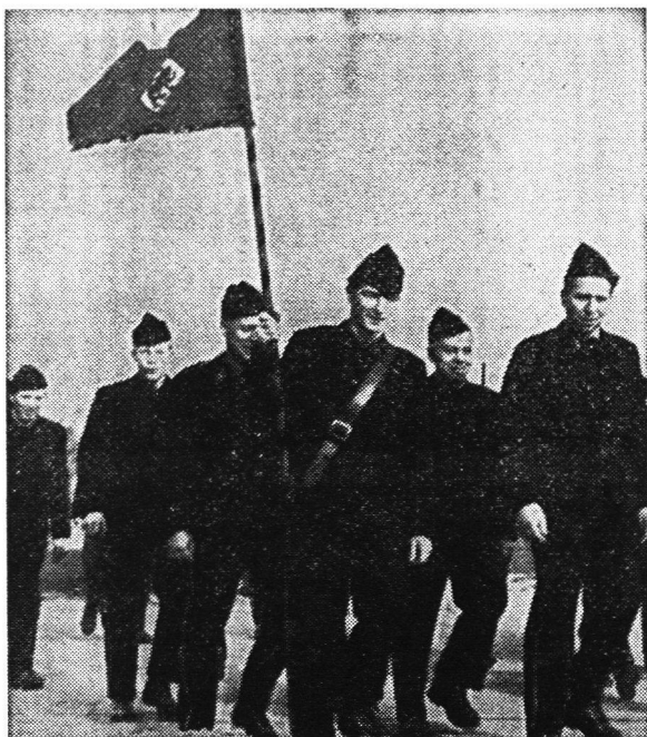
Auch die Feuerwehr der Bundesstadt war mit dabei Le service du feu de la Ville fédérale était présent lui aussi

Parteciparono pure i pompieri della capitale