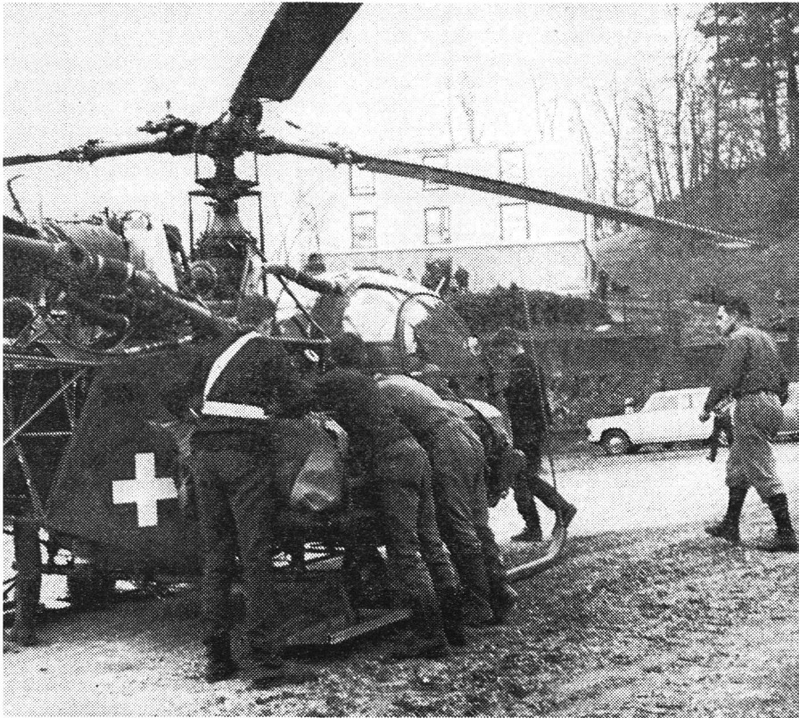
① Ein Bericht von Peter Amstutz, Luzern

Kernser Schulbuben zeigten den Erwachsenen, was hinter der Idee des Zivilschutzes steckt