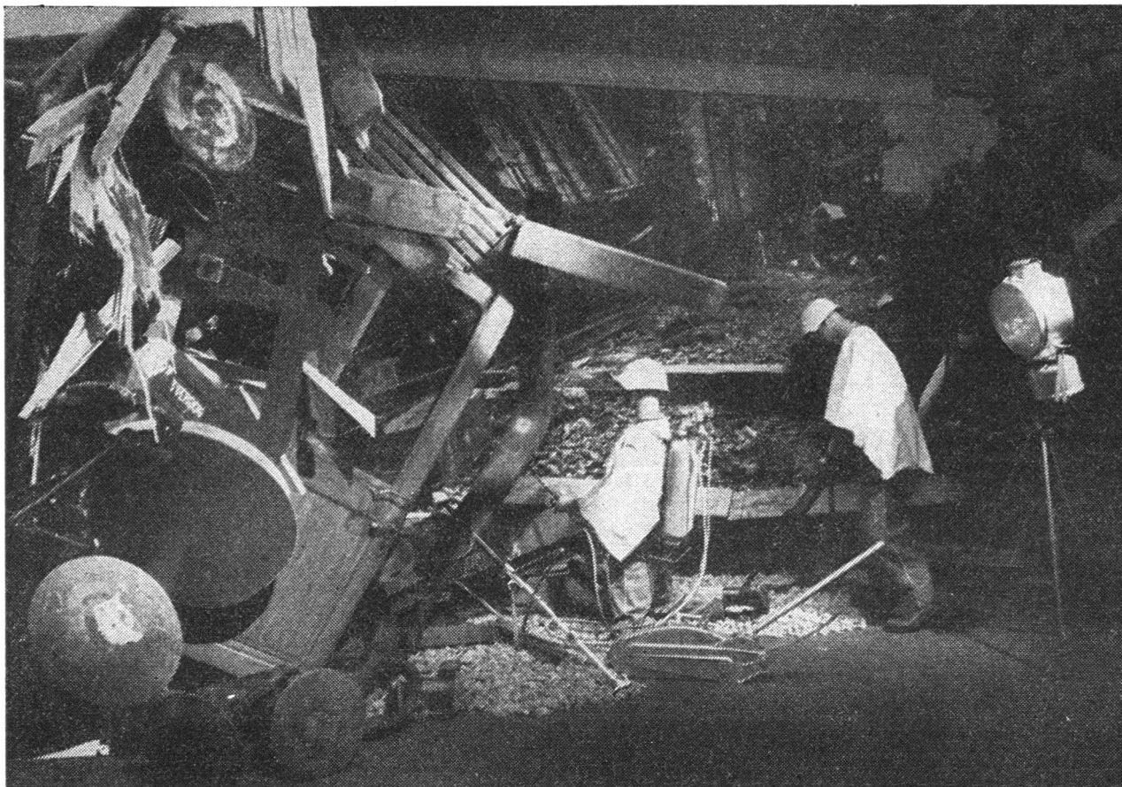
Zivilschutz ist auch Katastrophenschutz