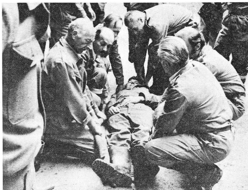
Les sanitaires au travail (exercice de transport)