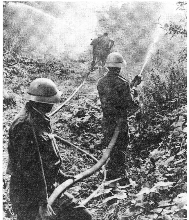
Sapeurs-pompiers de guerre en action