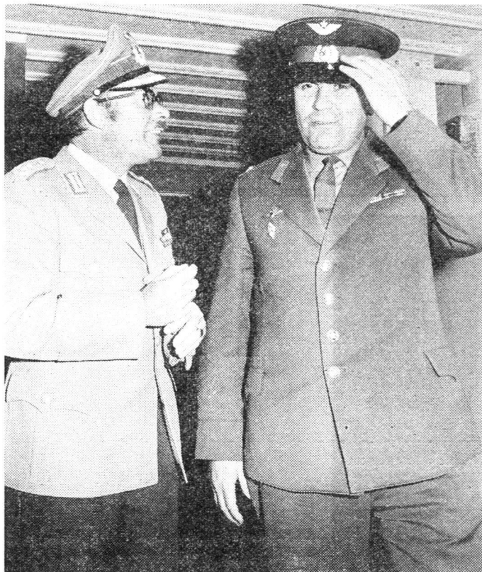
Mit grossem Interesse folgten die in Bern akkreditierten Militärattachés der Uebung, nachdem sie vorher Gelegenheit zum Besuch bei den Luftschutztruppen erhalten hatten. Hier unterhalten sich die Militärattachés der Bundesrepublik Deutschland und der Sowjetunion über ihre Eindrücke