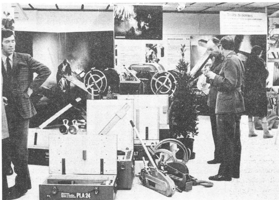
Blick durch die Ausstellung, die auf 400 m 2 einen umfassenden Einblick in den Zivilschutz bot. Die Schau wurde ergänzt durch Filmvorführungen und Demonstrationen in der Ersten Hilfe, die zu bestimmten Zeiten angekündigt wurden