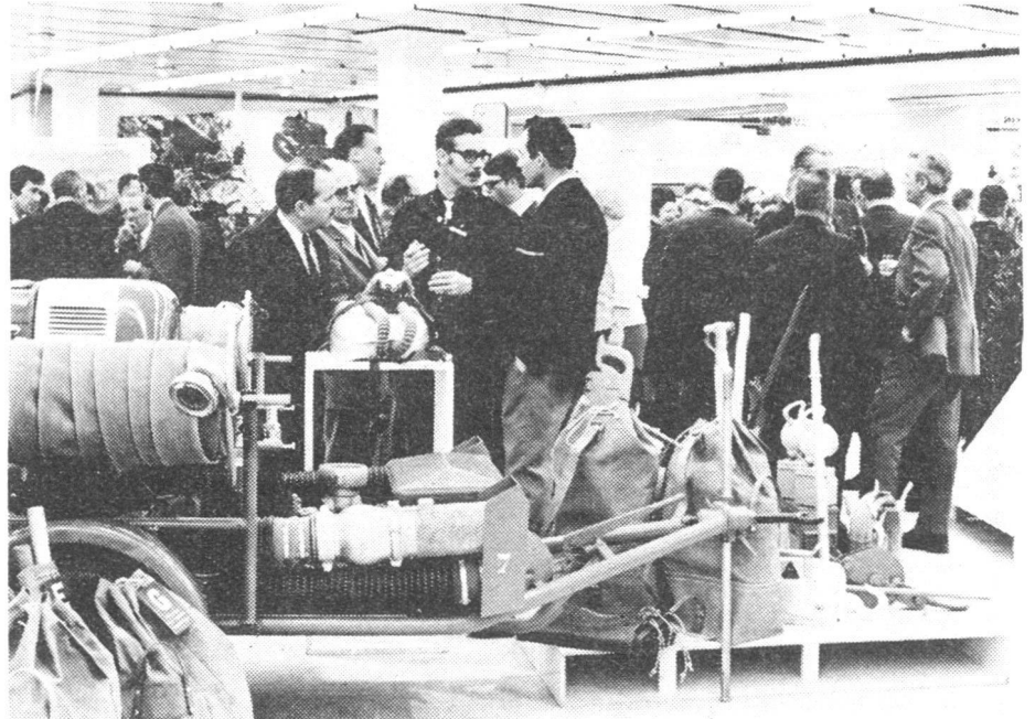
Interessierte Besucher am Eröffnungstag, die vor allem das moderne und reichhaltige Material bestaunten, das aus den Beständen des Lausanner Zivilschutzes zur Verfügung gestellt wurde