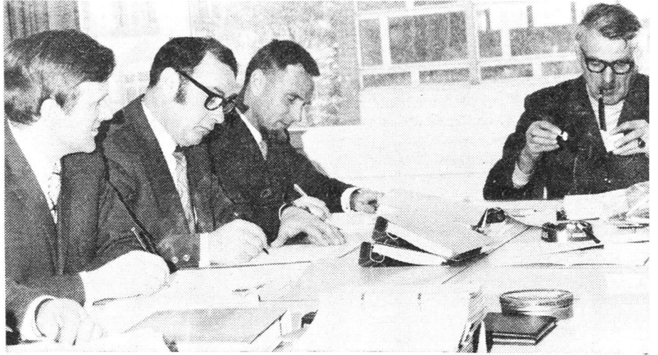
Der Klassenarbeit wurde grosse Bedeutung beigemessen

Der Rapport in Horw hat allen Verantwortlichen des Zivilschutzes in Gemeinden, Heimen, Anstalten, Spitälern und Industriebetrieben sowie Verwaltungen neue Ideen und erneuten Elan mitgegeben. Der Zivilschutz ist Gemeinnutz.