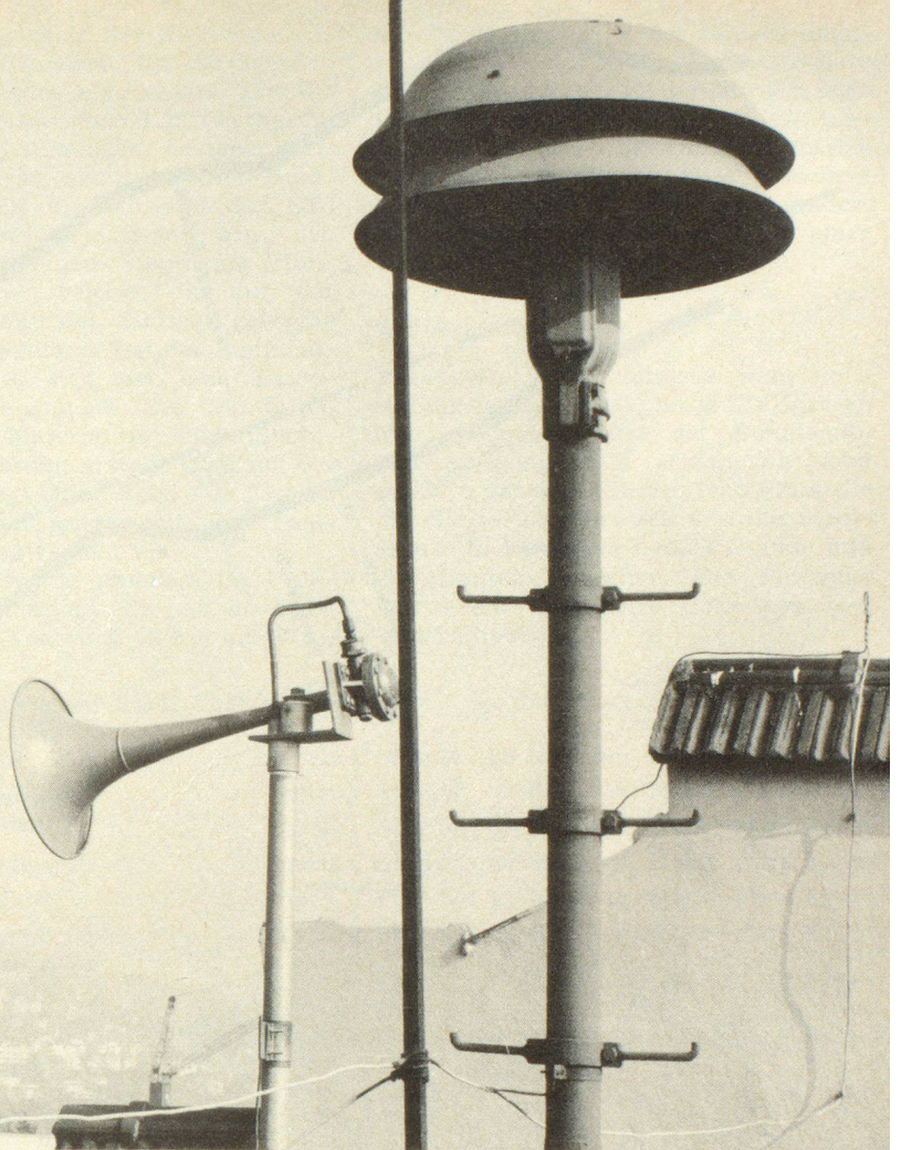
Das «Tyfon», die vom Stromnetz unabhängige Alarmsirene des Wasseralarms. Daneben rechts eine alte Luftschuttsirene

Im Rahmen einer Pressekonferenz wurde in Zürich eingehend über den «Wasseralarm — Sihlsee» orientiert. Es handelt sich um eine Organisation mit Geräten, die von den zuständigen Behörden bereits vor Jahren geprüft und beschlossen wurde, um im Sommer 1972 realisiert zu werden. Aus der Vielzahl des an der Pressekonferenz gebotenen Stoffes geben wir nachstehend die Ausführungen von Stadtrat Hans Frick und Ortschef Gustav Bauer bekannt, um unseren Lesern einen Einblick in die von den Zürcher Stadtbehörden gewählte Lösung zu bieten.