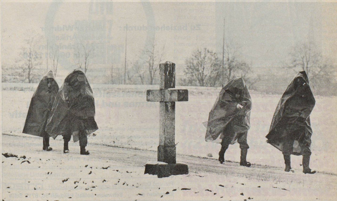
▼ Erfüllen eines Spürauftrages