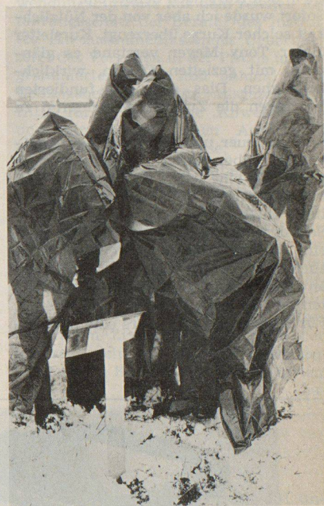
Patrouillen am Messposten