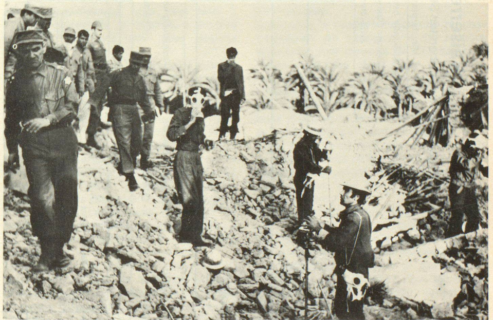
Einsatz von Ortungsgeräten bei der Suche nach unter Gebäudetrümmern verschütteten Dorfbewohnern

8. Bau von Aus- und Weiterbildungsstätten für das Instruktionspersonal, das obere Kader und die vollamtlich tätigen Berufsleute der Zivilschutzzeinheiten.