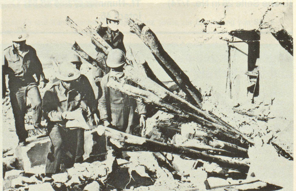
Beseitigung von Trümmern nach einem heftigen Erdbeben, Bergung und Rettung verschütteter Dorfbewohner durch Angehörige einer mobilen Zivilschutzeinheit