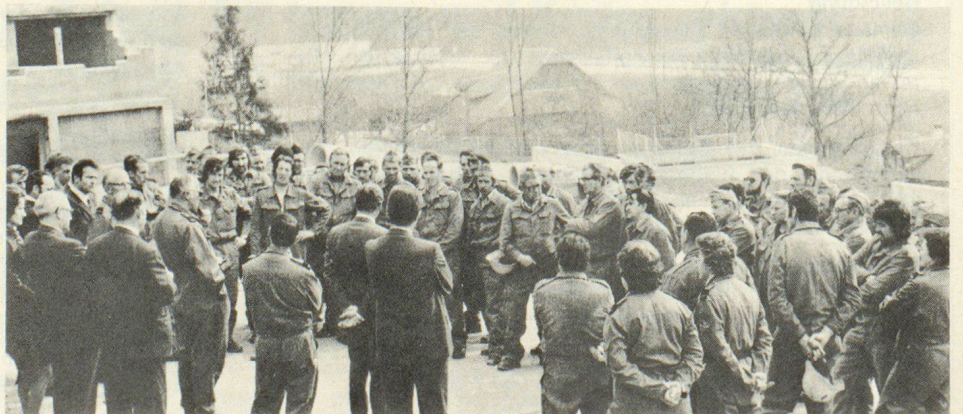
Unterwegs kam es oft zu Aussprachen mit Fachleuten oder kurzen Ansprachen an die Kursteilnehmer wie hier im ZS-Ausbildungszentrum der PTT in Spiez/Gesigen