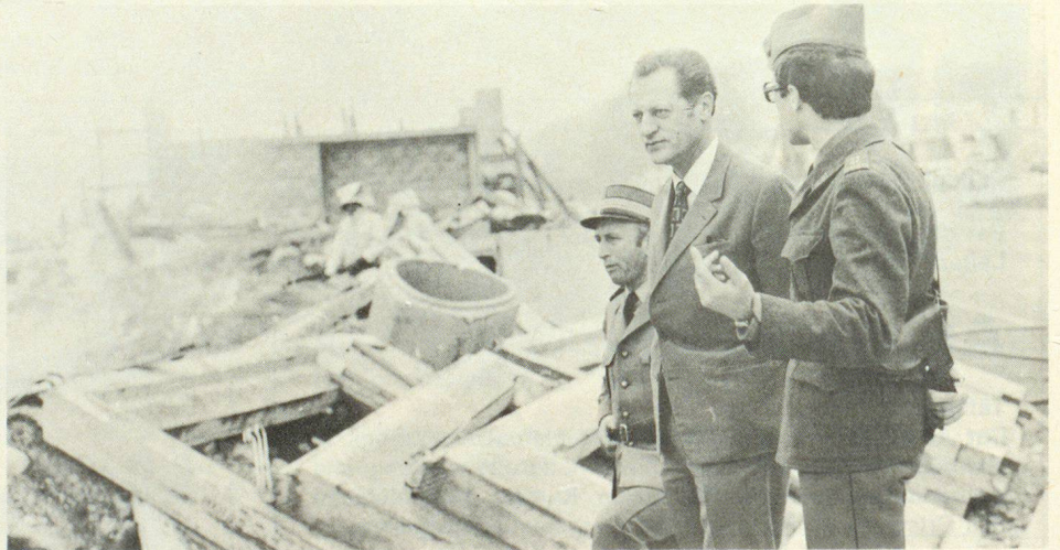
Besonderes Interesse fanden auch die Details der Ausbildung unserer Luftschutzsoldaten. Hier ein Schnappschuss aus dem Übungsdorf in Wangen a.d.A.