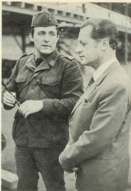
Oberst Etan Shimshoni im Gespräch mit einem Offizier der Luftschutztruppen in Wangen a.d.A.