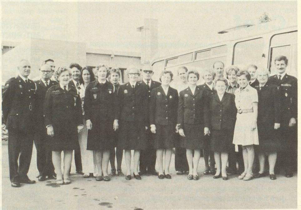
Die englischen ZS-Gäste mit ihren Betreuern in Steffisburg

Dank dem guten Wetter und der Umsicht der Gastgeber in Steffisburg wurde die Reise zu einem grossen Erfolg. Besonders begeistert äusserten sich die Gäste auch über Organisation, Aufbau und Einrichtungen des Schweizer Zivilschutzes, was nach ihrer Ansicht zum besten Standard gehört, was sie in den letzten Jahren auf ihren Reisen durch Europa gesehen haben.