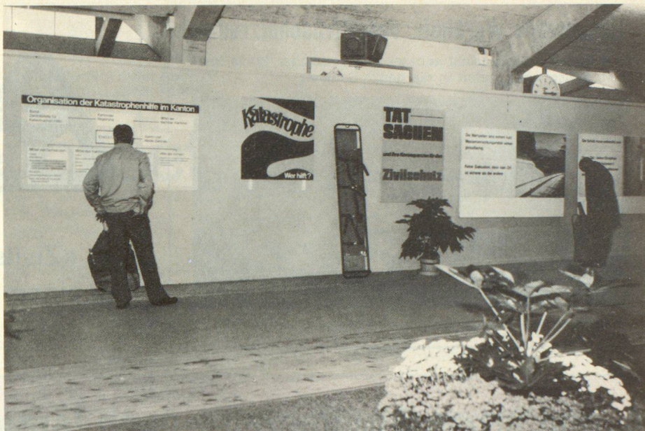
Ausschnitt aus der Ausstellung «Zivilschutz ist auch Katastrophenschutz» an der «Gemeinde 74» in Bern, die allgemein Beachtung fand

Besonderes Interesse erregte in den weitläufigen, in vier Blöcken unterteilten Anlagen, die zusammen über 800 Betten, zwei Küchen und zahlreiche weitere Einrichtungen verfügen, der Operationsraum in der Sanitätshilfsstelle.